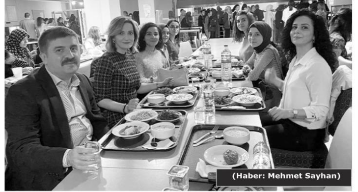
(Haber: Mehmet Sayhan)

Öğrenciler ile birlikte sıraya girerek iftar yemeğini alan Vali Sarıbrahim, "Ramazan ayı ülkemiz ve İslam âlemi için hayırlara vesile olmasını temenni ediyorum. Tüm öğrencilerimize derslerinde ve sınavlarında başarılar diliyorum" dedi.